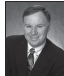
Senator Leonard Lee Rawson