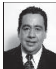
Dip. Hector Ruben Espino