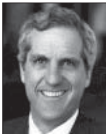
Senator Eliot Shapleigh