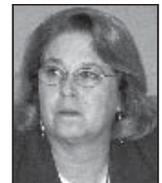
Senator Denise Moreno Ducheny