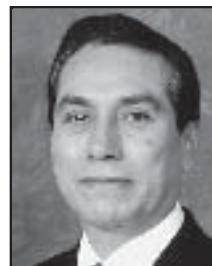
Diputado Arturo Becerra Valadez