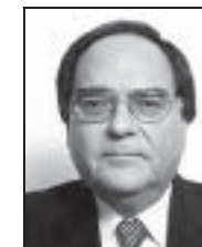
Dip. Carlos Galindo Meza