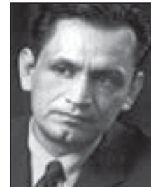
Senator Gilbert Cedillo