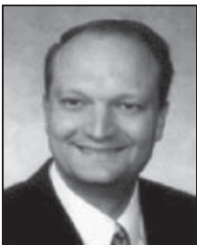
Senator Timothy S. Bee