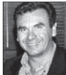
Diputado Javier Villarreal Terán