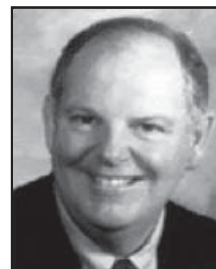
Representative Tom O'Halleran