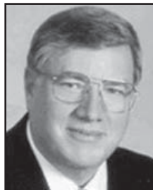
Senator Robert Cannell