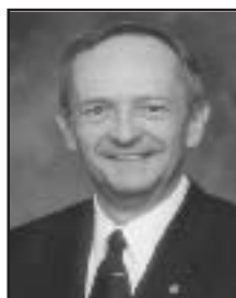
Senator Jeff Wentworth